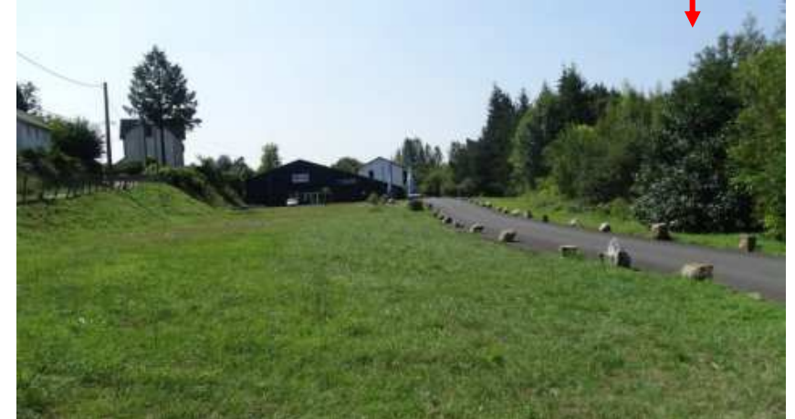
L'ancien emplacement des voies de la gare

Depuis quelques années, le tracé est le parcours de la « Transcailladou » (surnom de la ligne), course pédestre et randonnée d'Uzerche à Tulle.