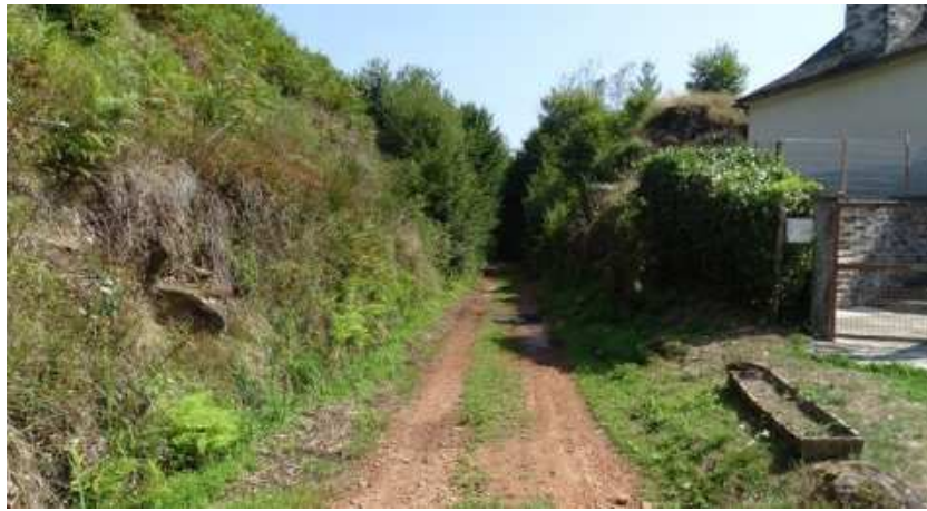
L'ancien tracé au moulin du Mazel

Suite à la fermeture du trafic, les rails ont été retirés en 1972 et en 1978. Une partie du tracé de la ligne a disparu, rattaché aux champs ou prés jouxtant la ligne ; une autre est devenue route ou chemin piétonnier. Quelques fragments sont restés en l'état, abandonnés et envahis par la végétation environnante.