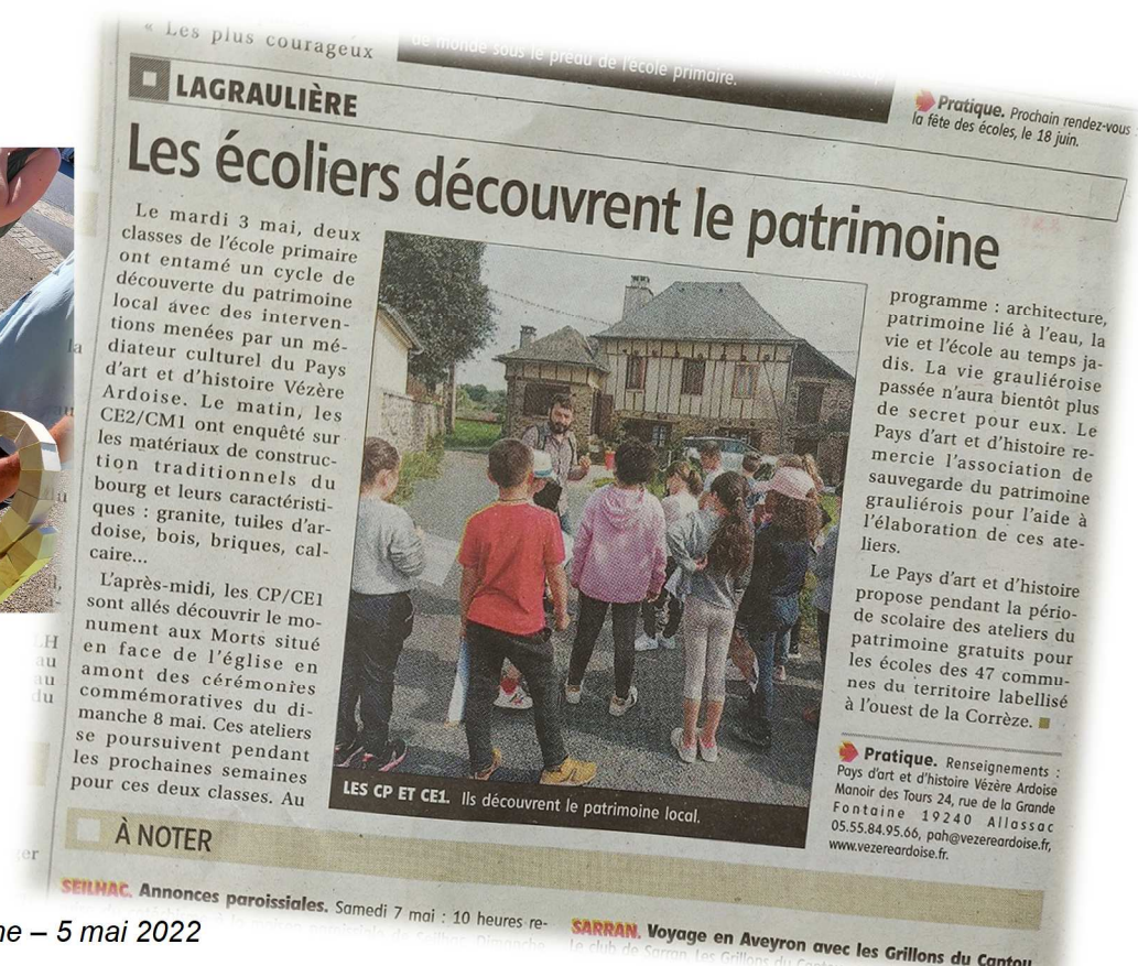
La Montagne – 5 mai 2022