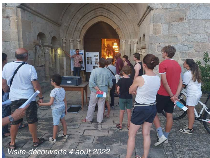
Visite-découverte 4 août 2022